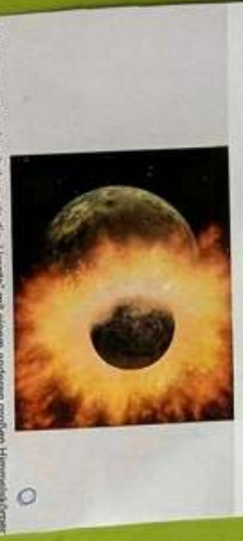
So kann es ausgesehen haben, als die Urerde mit einem anderen großen Himmelskörper zusammenstieß. Das war vor über 4 Milliarden Jahren.

→ Die Erde besteht aus Meeren aus Wasser (1) die Feste Erde besteht aus Wäldern, Inseln und Wüste. (2)